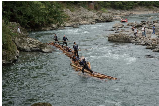
保津峡を下る筏 2009 年 9 月 9 日