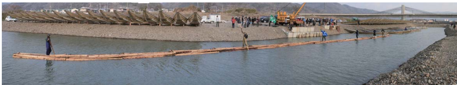
保津川で復活した 12 連筏 2014 年 2 月 16 日