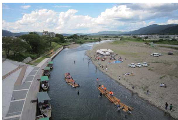
いかだ試乗会 2012 年 9 月 15 日