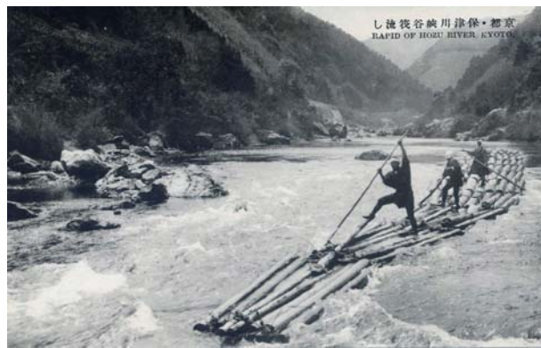
保津川の筏流し 昭和初期の絵葉書

この貴重な歴史遺産を多くの方々が体験し、かつて流域を結んだ川の営みを実感していただくことで、「筏がつなぐ歴史の記憶」を甦らせたいと考えています。