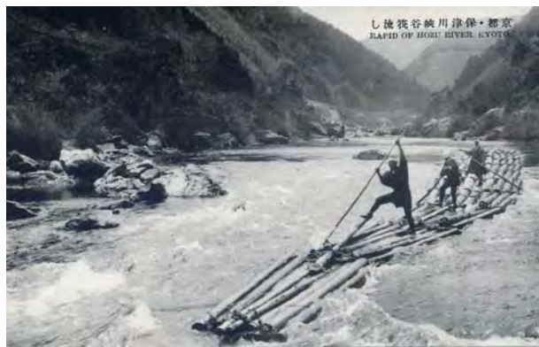
保津川の筏流し 昭和初期の絵葉書

この貴重な歴史遺産を多くの方々が体験し、かつて流域を結んだ川の営みを実感していただくことで、「筏がつなぐ歴史の記憶」を甦らせたいと考えています。