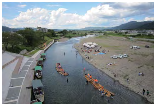
いかだ試乗会 2012年9月15日