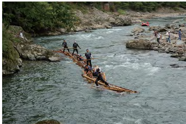
保津峡を下る筏 2009年9月9日