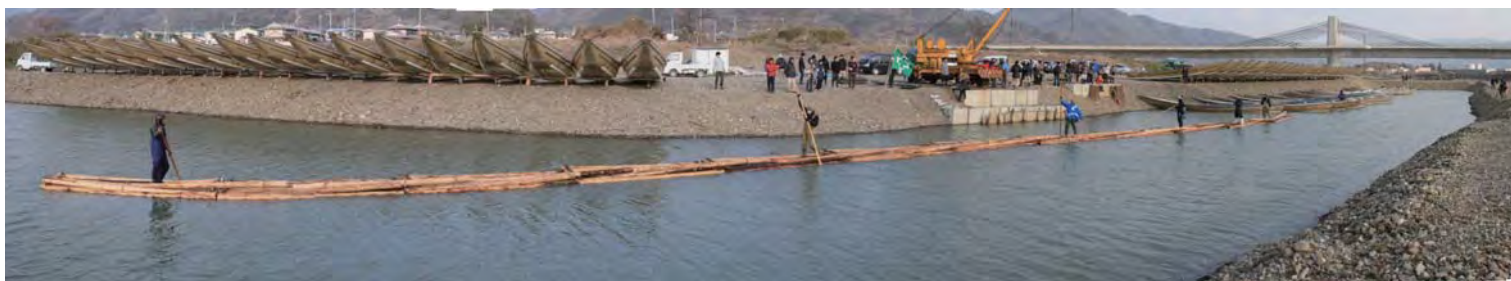
復活した12連筏 2014年2月16日